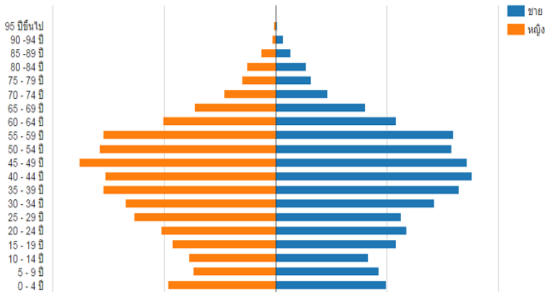
แผนภาพที่ ๔ พีระมิตประชากรตำบลแม่ปะ